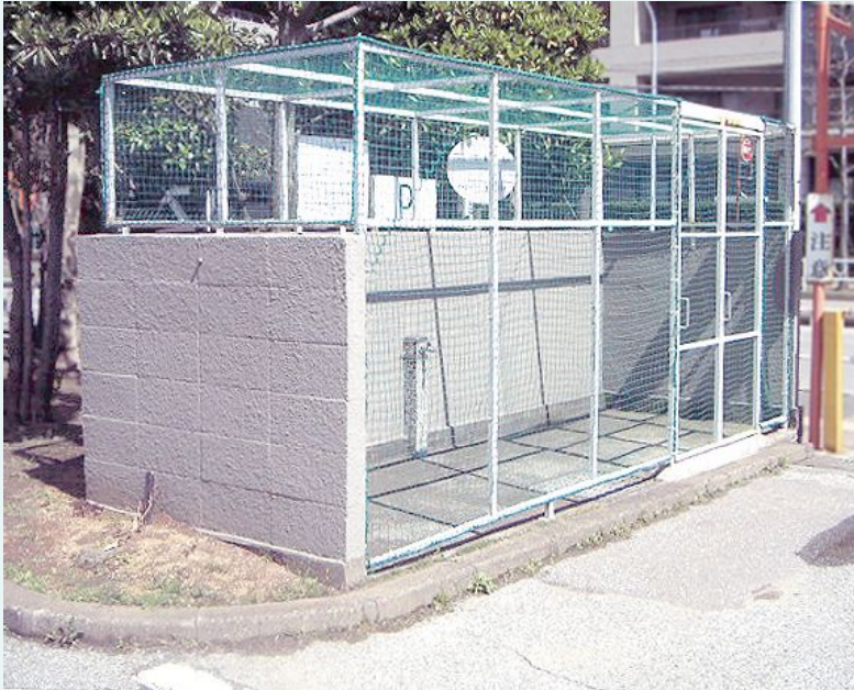
固定設置型ポリエチレンネット標準タイプ