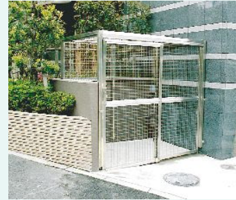
固定設置型ステンレスタイプ