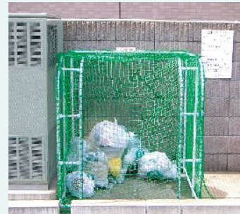
簡易設置型(特許番号315813)